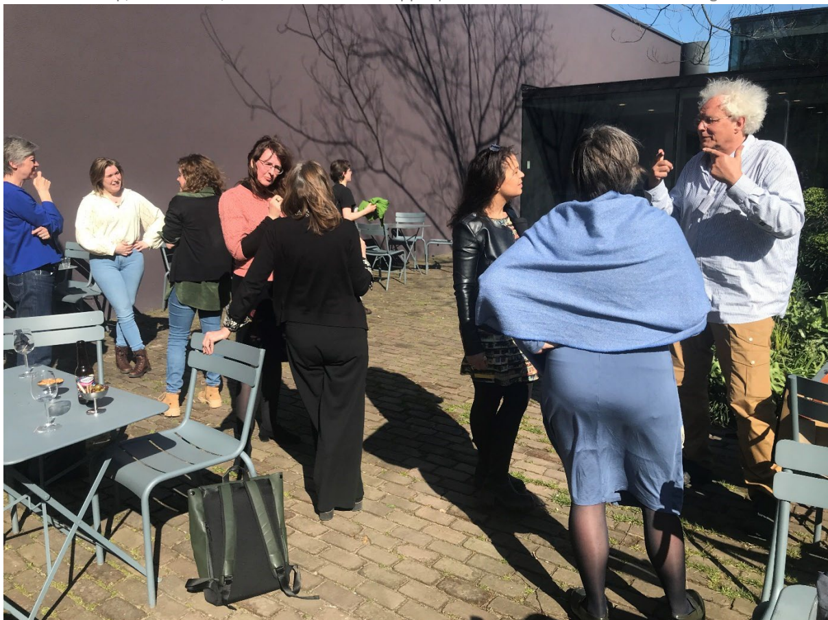
Deelnemers OH-SMArt Symposium 2023 tijdens afsluitende borrel bij De Pont.