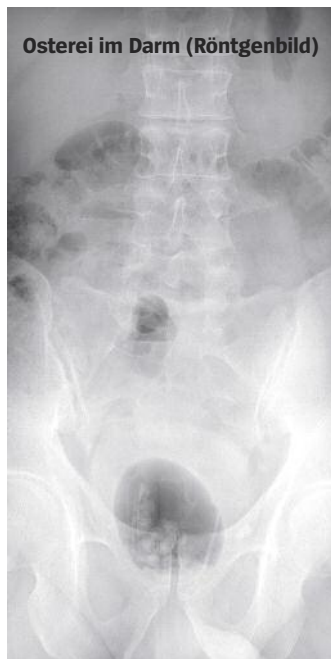
Osterei im Darm (Röntgenbild)

Rassweiler: Ja, aber es kommt vor, ebenso wie diese Fälle, in denen sich Leute Dinge wie Kabel, Bleistifte oder Glasröhrchen in die Harnröhre einführen. Alles schon da gewesen. Den Bleistift konnten wir erst entfernen, nach-