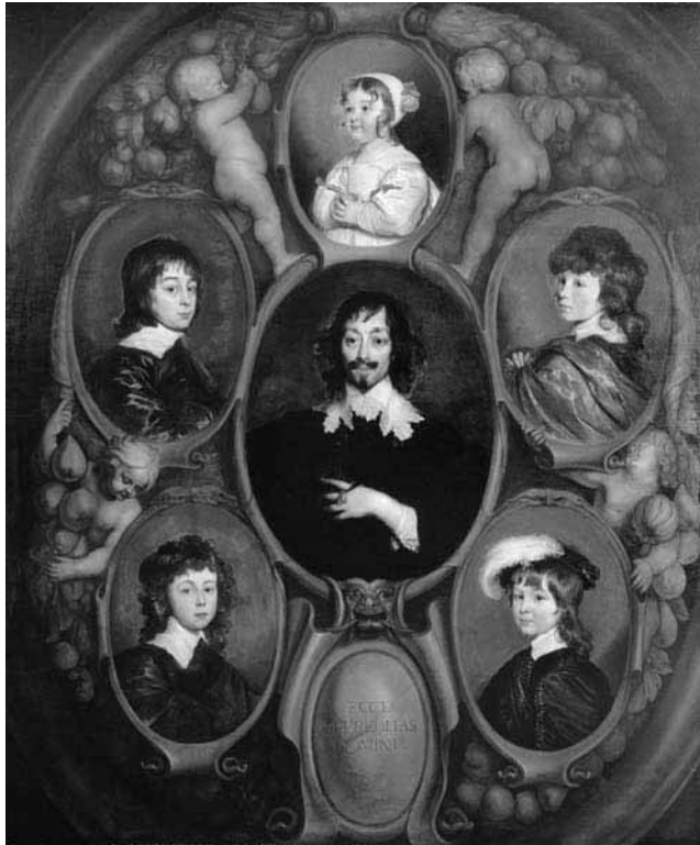
Afb. 3 Huygens als weduwnaar, omringd door zijn vijf kinderen. Door Adriaen Hanneman. In de voorstudie was Susanna naast Huygens afgebeeld.

zie-oefening om het geheugen te testen. Tot haar genoegen lukt het om de vijfjarige Constantijn jr. een flinke passage van buiten te laten leren uit het Voorhout , en die 'seer bevallich' te declameren. 46 Wat een thuiskomst zal dat zijn geweest voor de vader. Het jaar daarop begint ze met lesjes lezen en spellen. 47