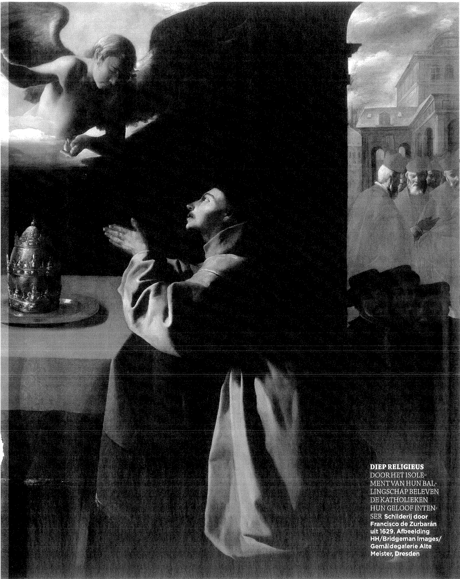
DIEP RELIGIEUS DOOR HET ISOLE- MENT VAN HUN BAL- LINGSCHAP BELEVEN DE KATHOLIEKEN HUN GELOOF INTEN- SER Schilderij door Francisco de Zurbarán uit 1629.