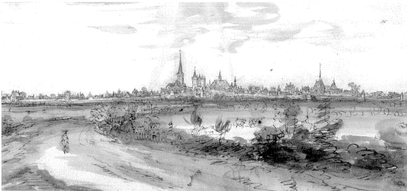
ENCLAVE IN DE ZEVENTIENDE EEUW IS KALKAR EEN VEILIGE HAVEN VOOR KATHOLIEKE VLUCHTELINGEN UIT DE NEDERLANDEN

de eveneens Amsterdamse familie Bam. Het pronkstuk is ongetwijfeld de grote zilveren monstrans die getooid is met het wapen van de Amstelstad.