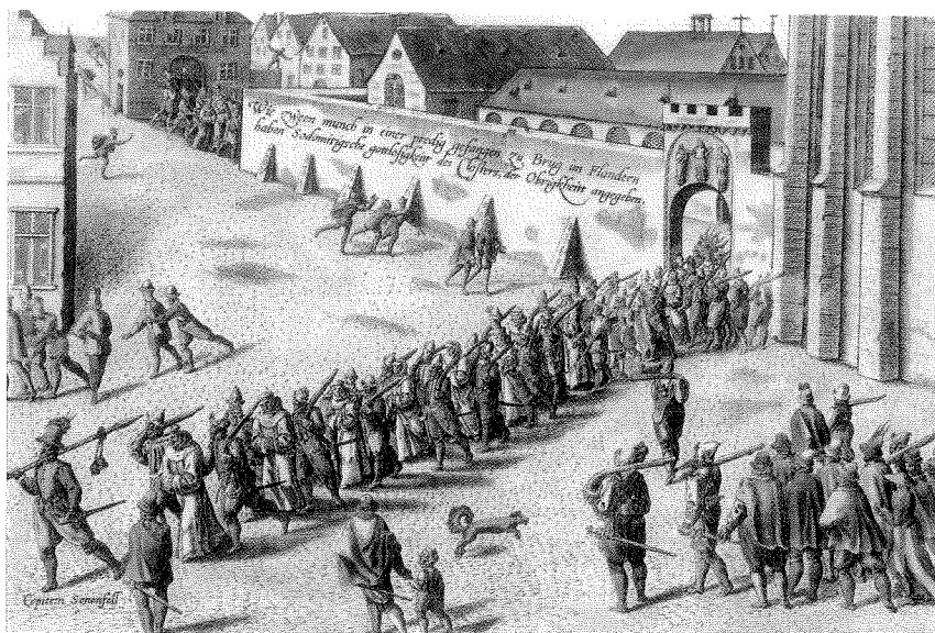
ZUIVERING DE NIEUWE MACHTHEBBERS JAGEN DE KATHOLIEKE GEESTELIJKEN DE STAD UIT Gravure door Frans Hogenberg uit 1583.