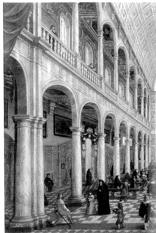
HEROÏSCH DE JEZUÏETEN WETEN HET BALLINGSCHAP EEN VERHEVEN STAPTUS TE GEVEN Schilderij door Sebastiaan Vrancx uit 1620 van een Jezuïetenkerk in Antwerpen.

DE KATHOLIEKEN IN BALLINGSCHAP waren aanvankelijk vol vertrouwen dat ze binnen afzienbare tijd konden terugkeren. Het was immers niet voorstelbaar dat