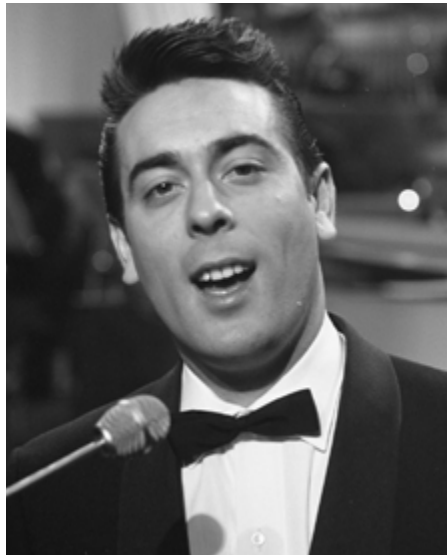
Gert Timmerman is nog vrij onbekend als hij in 1962 deelneemt aan het Nationaal Songfestival. In 1963 scoort hij zijn grote hit " Ik heb eerbied voor jouw grijze haren "

Maar over dit soort zaken gaat het helaas in het debat nauwelijks. U ziet het al aan de functies van degenen die in het forum zitten: een geneesheer, een hoogleraar financiën, een macro-econoom en een marketingprofessor. En inderdaad, het gaat in dat uur vrijwel