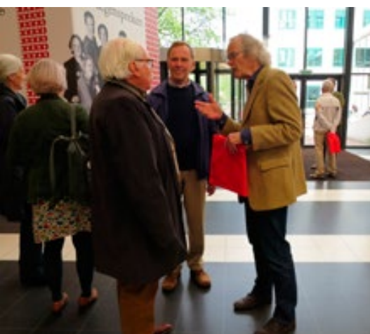
Bezoek aan het Roeterseilandcomplex p.8