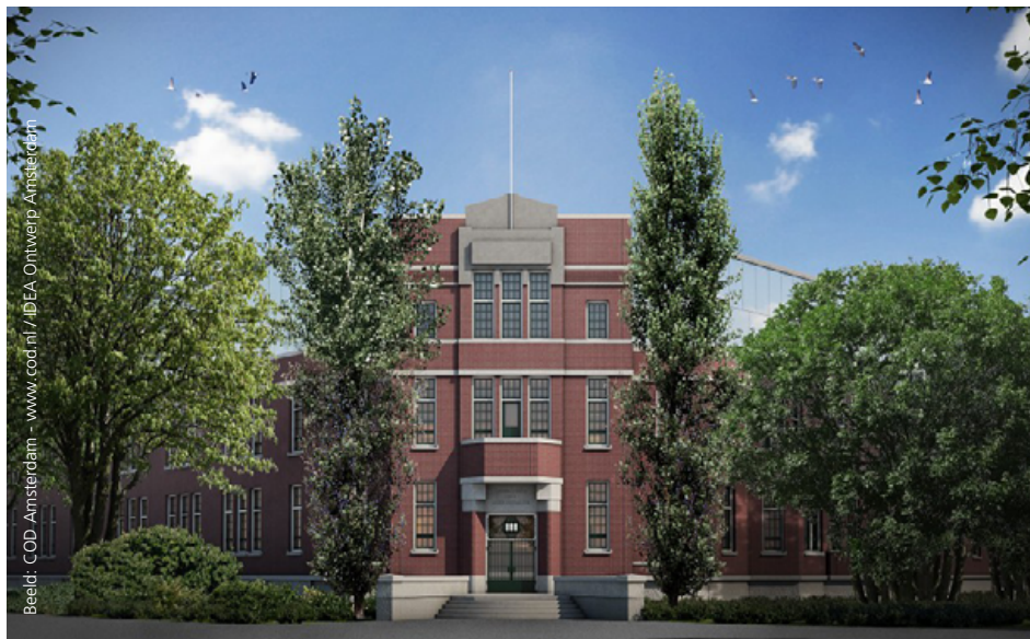
In het Laboratorium voor Gezondheidsleer in het Oosterpark opent volgend jaar een hotel

Het lab werd eind 1916 opgeleverd. Honderd jaar later zal het worden omgebouwd tot hotel, het Generator Hostel Amsterdam. Tussendoor huisvestte het nog het Zoölogisch Museum, voordat dit in 2011 vertrok naar Naturalis in Leiden (zie de Uitdienstbode juni 2015).