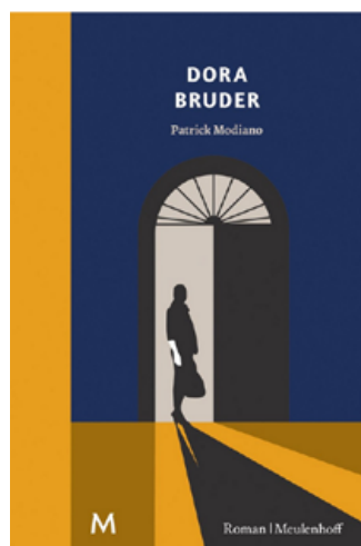
Dora Bruder , geschreven in 1997 door Patrick Modiano