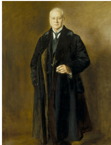
Schilderij van Rudolf Hendrik Saltet, vervaardigd door Anton Gregoritsch

'De Series Lectionum, van ouds in het latijn opgesteld, geeft volgens het oordeel der litterarische faculteit (en van den Senaat op haar voorstel), niet voldoende inlichting aan hen, die in Amsterdam studeeren of voornemens zijn zich hier als student te laten inschrijven. Met goedvinden van Curatoren en Burgemeester en Wethouders is er nu een publicatie in de Nederlandsche taal verschenen, waarin behalve de opgave der lessen, ook nog allerlei andere bijzonderheden zijn vermeld: de voorwaarden voor het afleggen der examens, de bijzondere regelingen van docenten van hun onderwijs, lesroosters enz. (...) Het boekje is bewerkt door een Senaats-Commissie, bestaande uit de secretarissen der faculteiten. Het is in de stadsdrukkerij gedrukt en voor