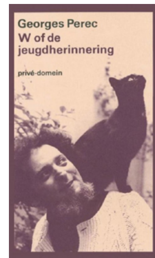
Van Perec verscheen in 1975 W of de jeugdherinnering .

Georges Perec is een Franse schrijver met Pools-Joodse ouders. Zijn vader sterft aan het front in 1940, Perec is dan vier jaar. Zijn moeder zet hem twee jaar later vanuit Parijs op de trein naar de vrije zone. Hij wordt daar ondergebracht op een kostschool en heeft om veiligheidsredenen weinig contact met familieleden. Na de oorlog keert hij terug naar Parijs en wordt daar door een zuster van zijn vader opgevoed.