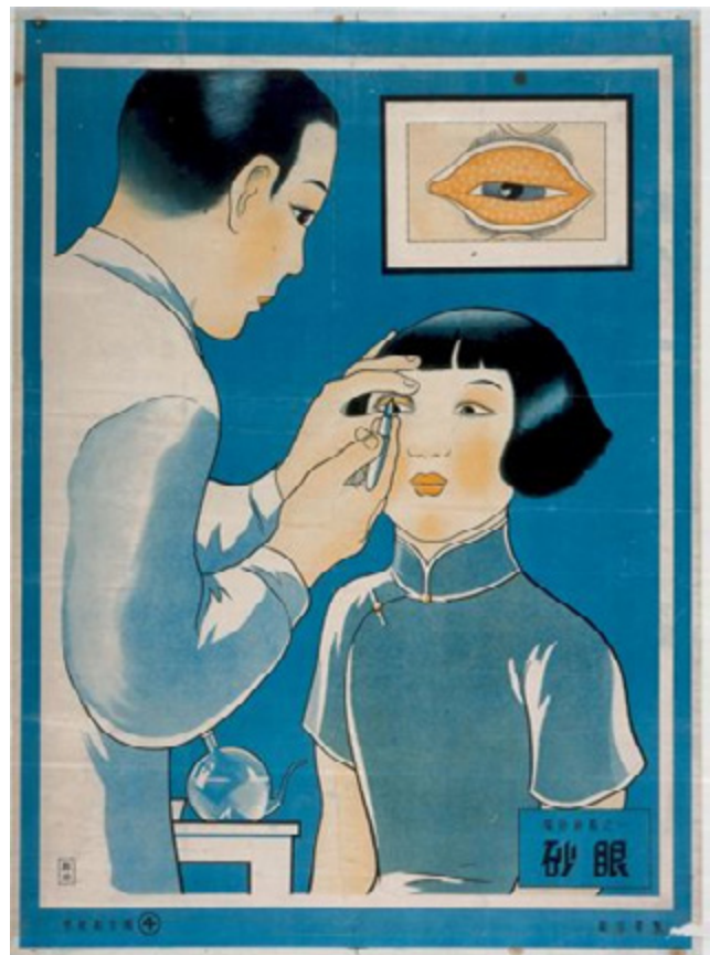
► 'Trachoom' (s.a.)