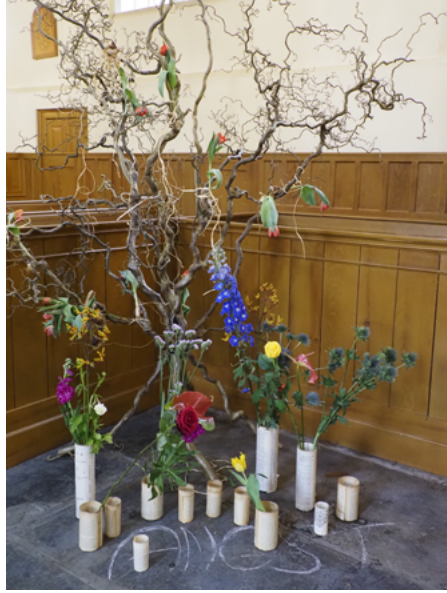
Bloemen bij de basise motie: Angst

Na de muziek is het tijd voor de bloemen, waarnaar menigeen tijdens het pianospel heeft zitten kijken. Het is aan ons om er nu een of enkele te selecteren die passen bij de emoties waarin we ons hebben verdiept. Horen roos, tulp, de ereprijs of gerbera bij een ervan, bij meerdere misschien? In tegenstelling tot hun geheime krabbels op de kaartjes, is nu ieders keuze openbaar. Maar dat lijkt