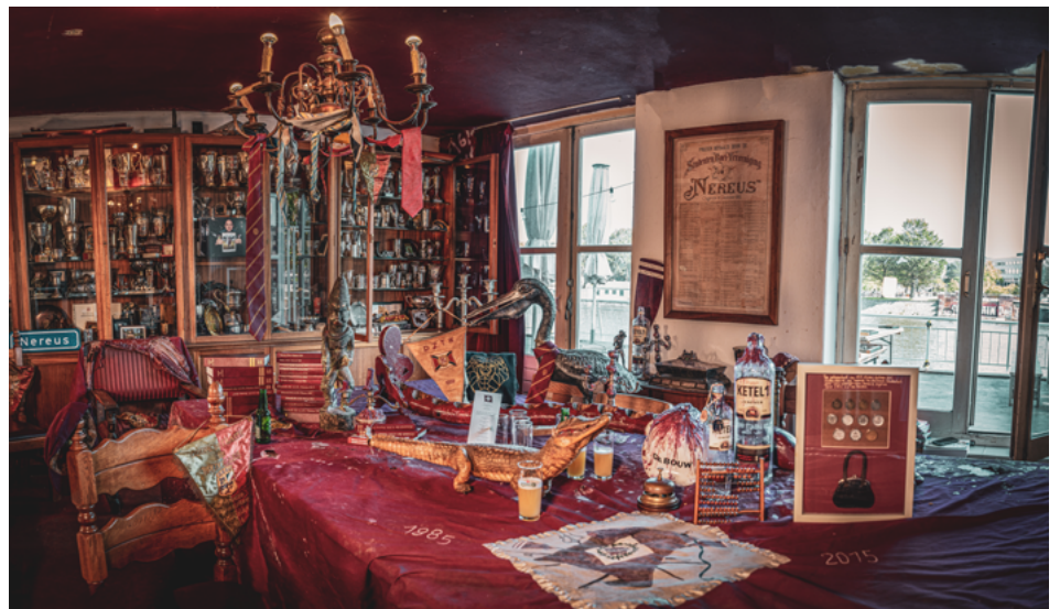
Bestuurskamer van Nereus vol verwijzingen naar de vele roeisuccessen.

werk van 800 pagina's met fraaie foto's, maar in de bijdragen vloeit veel bier en als vrouw zou ik me er niet prettig voelen: Nereus lijkt of is naast de sport ook een markt waar in allerlei bewoordingen onbekommerd sprake is van vleeskeuring van beiderlei kunne.