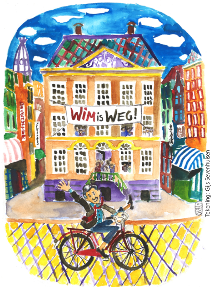
Tekening: Gijs Sevenhuisen

Het viel niet mee om erachter te komen, hoe op dit moment afscheid van medewerkers wordt genomen. Corona heeft namelijk niet alleen consequenties voor vertrekkende collega's, maar ook voor de bereikbaarheid van afdelingen. Uiteindelijk kon het hoofd P&O van de Faculteit der Rechtsgeleerdheid mij meedelen dat het afscheid maatwerk is, dat de collega's van de vertrekkende vaak worden uitgenodigd om op een bepaald tijdstip (bijvoorbeeld tussen 9 en 10 uur) betrokkene te bombarderen met mails, dat er een cadeau wordt geregeld en dat er bloemen op het huisadres worden afgeleverd. Via-via kreeg ik een aardige mail van een hoogleraar. Hij berichtte: "mijn laatste officiële werkdag op de UvA was afgelopen woensdag 12 mei. De afdeling had een Zoom-borrel georganiseerd en ieder lid van de afdeling ontving vooraf een flesje champagne op zijn huisadres. Via Zoom sprak de decaan van de Amsterdam Business School een paar mooie woorden en werd het glas geheven. Het echte afscheid staat