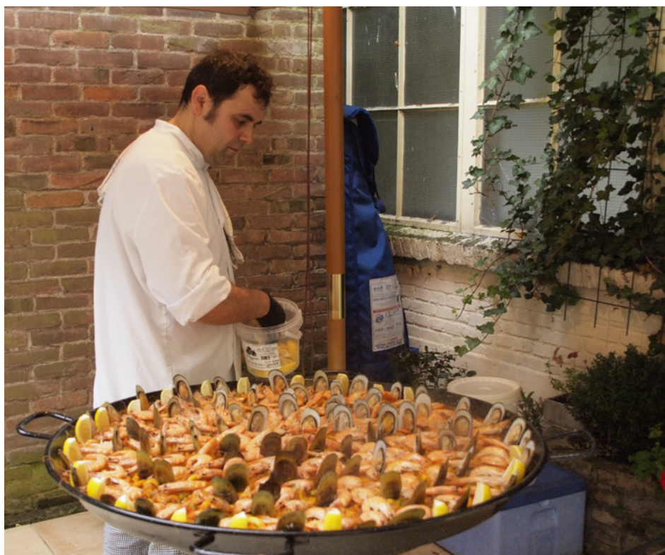
De Amsterdamse traiteur Pacomer heeft een Paella mixta bereid

De tien authentieke en oorspronkelijke ingrediënten voor de Paella valenciana zijn: paella-rijst (korte dikke korrel met groot absorberend vermogen), kip, konijn, grote witte bonen, Valenciaanse snijbonen, tomaat, saffraan, zout, olijfolie en water. Alleen de paella met deze ingrediënten mag zich Paella valenciana noemen. Naast deze paella worden er in Spanje ook paella's met andere ingrediënten gegeten. Zo is er naast de Paella valenciana in het Middellandse Zeegebied ook de Paella marinera (veel zeevruchten en vis). Het verschil tussen de twee paella's is dat de Paella valenciana een socarrat (een knapperige en smaakvolle korst op de bodem, essentieel) heeft en de Paella marinera niet, die is vochtiger dan de Paella valenciana . In andere delen van Spanje vind je paella's waar vlees, zeevruchten en vis gemengd zijn (de Paella mixta ), deze moet dan weer wel een socarrat hebben.