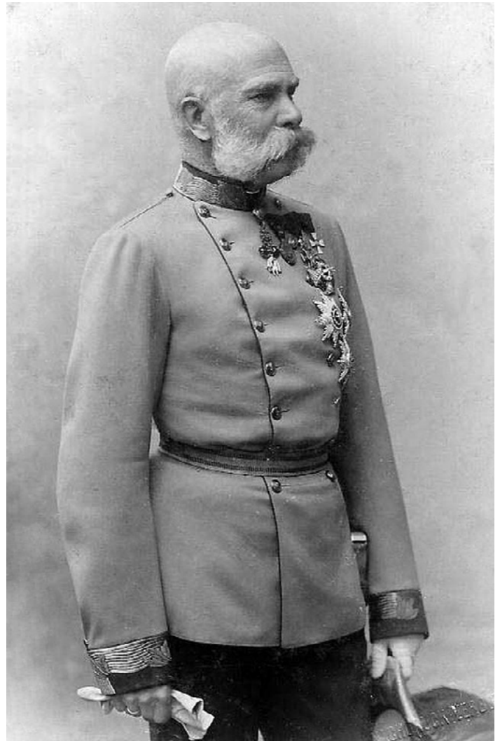
keizer Franz Joseph (Karl Pietzner, ca. 1885)

Er wordt in het boek weinig aandacht besteed aan de Europese Unie; ook niet trouwens aan de nationale staten, die juist in de tijd van Franz Joseph opkwamen. Er is vooral aandacht voor het Habsburgse Rijk en haar oordeel daarover is in het algemeen tamelijk positief. Natuurlijk was het alles wat wij vanzelfsprekend vinden niet , geen rechtstaat, geen democratie, er waren geen collectieve of sociale voorzieningen, maar het was een overheid waarvan de burgers relatief weinig last hadden. De overheid was helemaal niet geëquipeerd om het de burgers moeilijk te maken. Intussen was het voor de keizer voortdurend schipperen, polderen, uitruilen en bemiddelen tussen de vele volken en gemeenschappen die zijn rijk bevolkten. Werd de wens van één volk vervuld, dan stonden daarna andere volken op de stoep om ook iets te krijgen. De staat was nooit af. Er was wel onvrede over de manier waarop het rijk werd bestuurd, maar velen voeren relatief wel bij de welwillende, inefficiënte bureaucratie. Oorlog met het buitenland werd niet gevoerd; daar was het Rijk in al zijn verdeeldheid en zijn gebrek aan organisatie helemaal niet toe in staat. Het boek staat vol prachtige anekdotes over de tijd van Franz Joseph. Die ga ik niet herhalen. Dat kan De Gruyter beter.