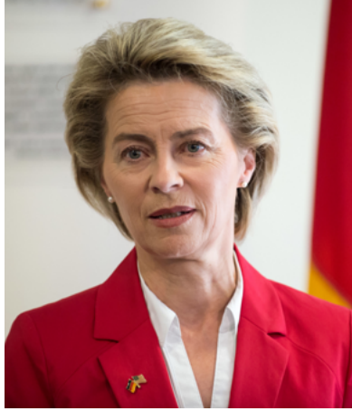
Ursula von der Leyen, het gezicht van de EU

De Gruyter is overwegend positief over Oostenrijk-Hongarije. En dat is verrassend, want dat rijk stond destijds toch bekend als 'de zieke man van Europa'. Zo is men er in de geschiedschrijving ook over blijven denken. Het Rijk was – zo was de algemene opinie – ten dode opgeschreven. Het was intern verzwakt, het bestuur was inefficiënt, etc. Eigenlijk alles wat De Gruyter positief duidt, maakte het Rijk in West-Europese ogen tot een vermolmd, onbe-