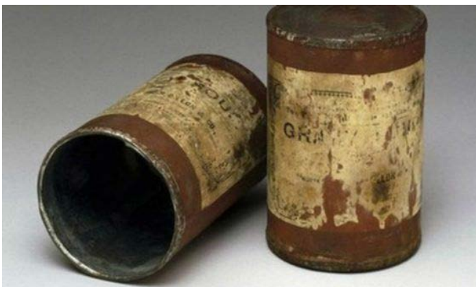
Metalen blikken van binnen gecoat met tin