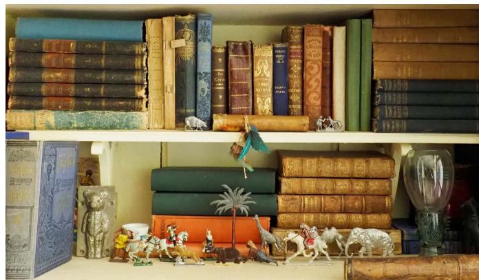
Goedgevulde boekenkasten en snuisterijen

'De hormonen gierden door mijn lijf. Bovendien had ik een ernstig conflict met de tucht prefect van de school die mij veel te vrijgevochten en te brutaal vond. Het was overigens niet alleen maar kommer en kwel op die school: ik kreeg celloles met het idee om uiteindelijk in het schoolorkest te komen en had een kamertje tot mijn beschikking om te oefenen. Daar organiseerde ik stiekem bijeenkomsten met een aantal jongens met wie ik een soort geheim genootschap vormde. Wij rookten en verstopten onze peuken, samen met briefjes waarop onze schuilnamen stonden, in een blikken sigarettendoosje. Niet zo lang geleden is dat bijna mythische blikje weer opgedoken: een