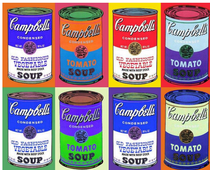
Campbell's soup can van Andy Warhol