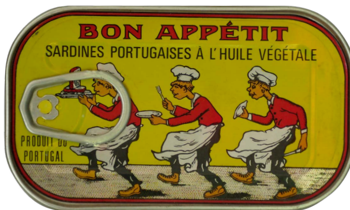
Een van mijn mooiste blikjes. Te mooi om open te maken.

vers. Bij doperwtjes zien we het omgekeerde, die kennen we eigenlijk alleen nog maar uit blik. Of uit de diepvries, véél beter. Zelf zal ik niet snel een blik opentrekken, met twee uitzonderingen: tomaten in blik en sardientjes. Hoewel de Hollandse tomaat, die in Duitsland de Wasserbombe werd genoemd, de laatste jaren aanzienlijk in kwaliteit vooruit is gegaan, haalt hij het nog steeds niet bij door de zuidelijke zongerijpte tomaat uit, meestal, Italië. Die zitten in die blikken. En ze zijn nog voor je ontveld ook. En sardientjes, ach sardientjes... Een van mijn vroegste eetherinneringen, van niet lang na de Hongerwinter. Hoe ze daar in die geurige olie lagen te blinken. Wina Born vertelt in haar Culinaire Herinneringen 7 dat ze die, in hun geopende blikje, als voorgerecht geserveerd kreeg in een gerenommeerd restaurant. U weet vast nog wel dat de blikjes geleverd werden met een sleuteltje, en dat openen héél vaak