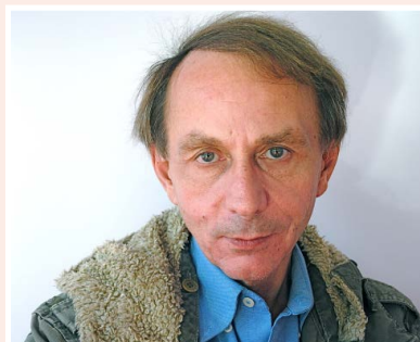
De Franse schrijver Michel Houellebecq

Op 15 mei van dit jaar drukte de Volkscrant een essay van de Franse schrijver Michel Houellebecq af waaruit ik het volgende citeer: “Een ander cijfer dat deze weken heel belangrijk is geworden, is de leeftijd van de zieken. Tot wanneer moeten ze worden gereanimeerd en behandeld? Dat hangt tegenwoordig kennelijk af van de vraag waar op de wereld je woont; maar nog nooit was nog nooit zo kalmpjes onbeschaamd het feit verwoord dat mensenlevens niet altijd en overal dezelfde waarde hebben; dat je vanaf een bepaalde leeftijd (70, 75, 80?) eigenlijk al een beetje dood bent.”