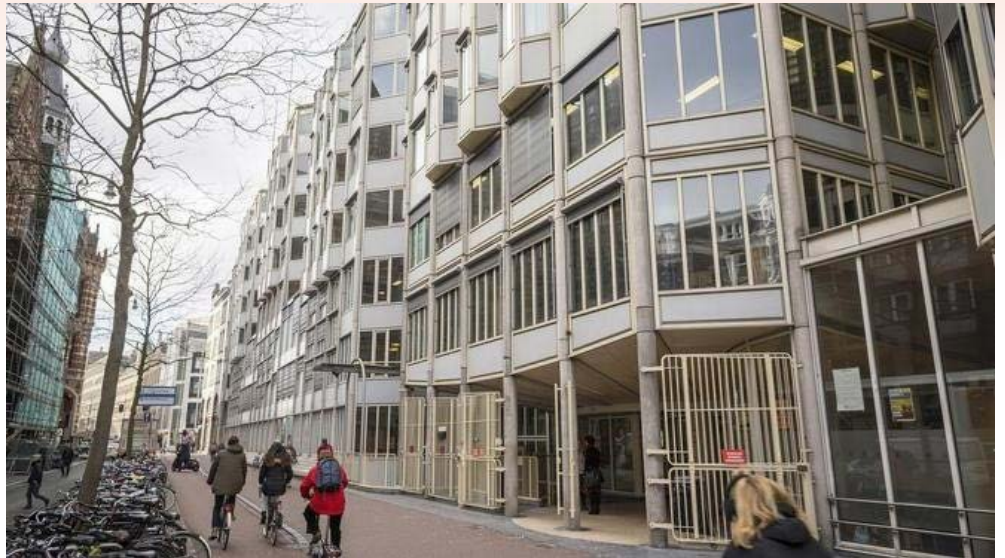
De toenmalige Letterenfaculteit was gevestigd in het P.C. Hoofthuis aan de Spuistraat (door de buurtbewoners de 'Letterbak' genoemd).

In augustus 1990 trad ik aan als directeur van de Letteren-faculteit van de UvA. Afkomstig uit het provinciale Tilburg voelde ik me wel een beetje geïmponeerd. Directeur van de grootste faculteit van de grootste universiteit van het land. En dat ook nog in het wereldse Amsterdam! Met enige spanning zag ik uit naar de eerste confrontatie met mijn ongetwijfeld door de Amsterdamse wol geverfde nieuwe collega's.