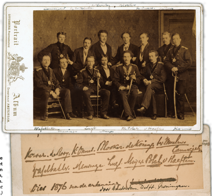
Mavors zorgde er in 1876 voor erkend te worden door andere corpora. Daarvan getuigt deze foto waarop de Senaat van het Medisch Militair Studentencorps zich heeft laten fotograferen met de rectoren van de studentencorpora van Amsterdam, Groningen en Delft, collectie Allard Pierson. (De foto met het handschrift is de achterkant van bovenstaande foto.)

Schietvereniging bij schietwedstrijden. Daar staken de resultaten van de studenten van Mavors maar magertjes bij af. Daarvan getuigt een voetnoot in bovengenoemde publicatie, best levendig geformuleerd ruim vijftig jaar na de opheffing van Mavors (pag. 378): "Het is zeker een opmerkelijk verschijnsel dat de schietvereniging van het militair-geneeskundig-studentenkorps Mavors, genaamd 'Soranus' (opgericht 1876) waarin men in de eerste plaats de goede schutters zou verwachten, voor zoover ons bekend, vrijwel niets heeft gepresteerd." Kennelijk hadden leden van Soranus zich wel in het schieten willen bekwamen, maar waren ze bepaald niet fanatiek. Stond de beoefening van de schietkunst of soldaatje spelen wellicht haaks op een toekomst als weliswaar militair maar vooral helend arts? ■