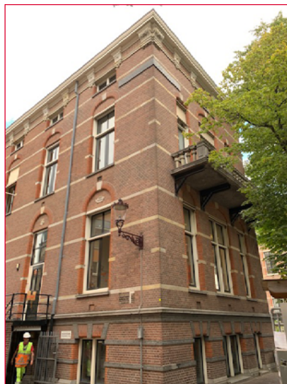
B.d.S. vlak onder de dakrand

Kortom: huisvesting die van zichzelf geen kwaliteit heeft, kan door een later toegevoegd kunstwerk niet gered worden. De commissie pleitte in 1994 ook voor “een huisvestingsplan met visie en aandacht voor kwaliteit en esthetiek”. Of de universiteit die aansporing wel nodig had, weet ik niet. Als het oordeel van de commissie heeft geleid tot meer aandacht voor de kwaliteit van de universitaire gebouwen is het Gevelproject, onbedoeld, een groot succes geweest. ■