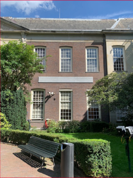
C.v.B. op de binnenplaats van de Oudemanhuispoort

Uiteindelijk is er maar één echt gevelproject geweest: Located Text , een kunstproject van Joseph Kosuth, bestaande uit teksten aangebracht aan de gevels van gebouwen van het Oudemanhuispoort- en Binnengasthuiscomplex. Het projectvoorstel van Kosuth stelde in alle bescheidenheid dat “de uitvoering relevant [was] voor de positie van de universiteit in relatie tot haar sociale, culturele en politieke betekenissen als onderdeel van de stad Amsterdam en in bredere context tot indeed, western society ”.