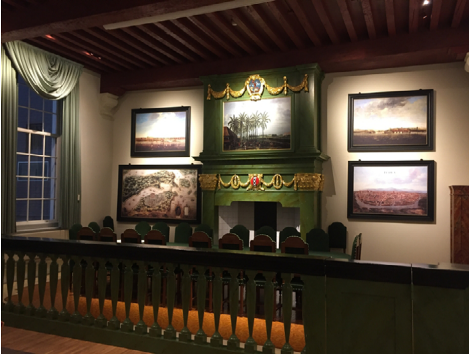
VOC-zaal in het Bushuis