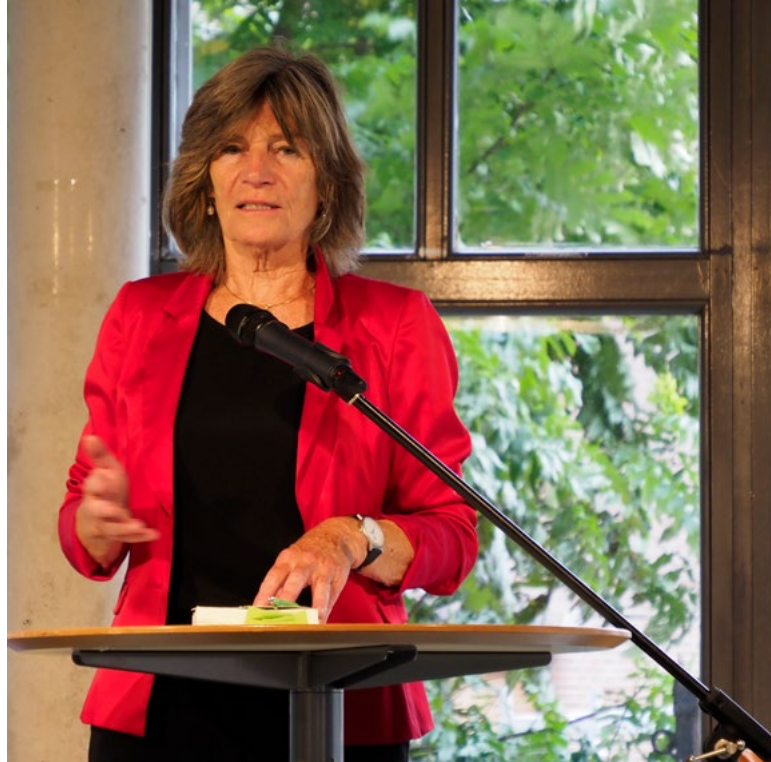
Geke van der Wal, auteur van In plaats van woede. Het leven van Guus Belinfante

Na de Bevrijding wilde Belinfante niet terugkeren in de advocatuur. Hij zocht zijn heil in een ambtelijke loopbaan, waar hij het recht op een ander niveau kon dienen. Door de recente geschiedenis waren het behoud van de rechtstaat en de transparantie van de bureaucratie voor Belinfante hoofdzaak geworden. De gevoeligheid voor inbreuken daarop zou Belinfante (en veel van zijn generatiegenoten) later nog opbreken. Onmiddellijk na de Bevrijding, al in de zomer van 1945, speelde Belinfante een vooraan-