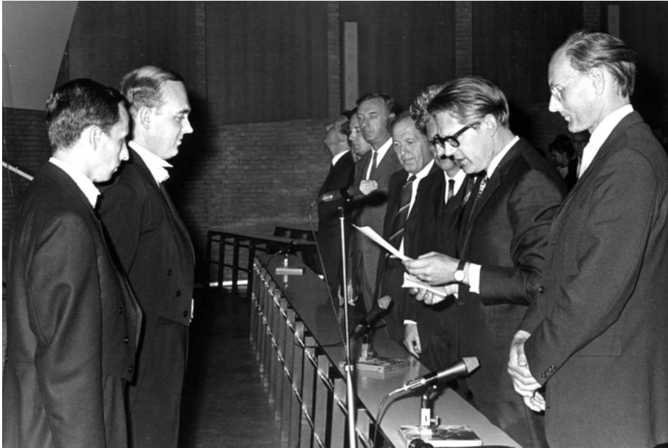
Promotieplechtigheid in de Oudemanhuispoort op 18 juni 1969

kundig Laboratorium waar ik mijn onderzoek had uitgevoerd, waren uitgenodigd. Een gezelschap waarmee de aula goed gevuld zou worden. Op de ochtend van mijn promotie – ik had mijn rokkostuum al opgehaald bij het verhuurbedrijf waar ik als student een regelmatige klant was – ontving ik telefonisch bericht van de pedel dat de Aula van de Universiteit deze dag door studenten bezet werd en dat naar een andere locatie moest worden omgezien. Bovendien, zo werd mij verteld, zou het cortège niet over de gebruikelijke ambtskleding kunnen beschikken want ook de togakamer was niet bereikbaar. En zo toog tegen half twee een flinke stoet belangstellenden van het hek voor de aula aan het Singel naar een zaal in het complex aan de Oudemanhuispoort. In een notitie over mijn universitaire loopbaan schrijf ik daarover: “Ik promoveerde nog net in de tijd dat professoren binnen de universiteit aan het roer stonden. Zij bezetten aanzienlijke functies binnen en buiten de universiteit en hun dagelijkse kleding illustreerde die positie. Ondanks het gemis aan toga en baret en de deelname van de pedel zonder rinkelende staf straalde het cortège toch een zekere waardigheid uit.” De actie rond de aula was een nasleep van de Maagdenhuisbezetting in de voorafgaande maand mei. Studenten ageerden tegen de straffen die de rechtbank van plan was op te leggen aan de Maagdenhuisbezitters. Om dat verzet kracht bij te zetten werd een nieuwe bezetting georganiseerd.