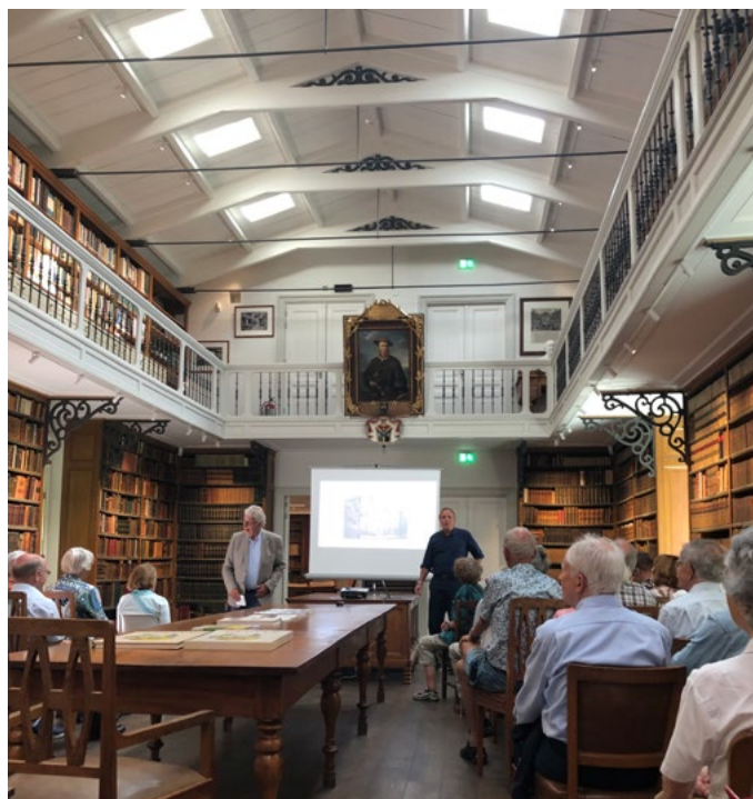
Linnaeus prijkt boven het projectiescherm en ziet toe op toegesproken gezelschap.