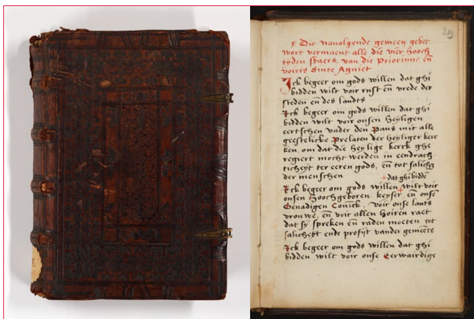
'Dit navolgend gemeen gebet', opgenomen in het necrologium van het Amsterdamse Agnietenklooster. Allard Pierson, Universiteit van Amsterdam, Hs. XXV C 77, pag. 319-322

In het Allard Pierson wordt het necrologium van het middeleeuwse Agnietenklooster in Amsterdam bewaard. Het is méér dan alleen een handgeschreven memorieboek, waarin voor elke dag van het jaar is genoteerd van wie het overlijden – vaak weldoeners – in de mis moet worden herdacht. Het bevat een kroniek gerekend vanaf het stichtingsjaar 1397 met aantekeningen tot 1599. Het necrologium bevat ook een gebed dat vier pagina's beslaat. Na een korte inleiding volgen er dertien alinea's die steeds beginnen met 'Ick begeer om gods willen dat ghi bidden wilt voir ...'. De 'ick' is de priorin van het klooster, die haar medezusters telkens vraagt om voor de in die alinea genoemde personen te bidden. Zij wordt geacht dit gebed te reciteren op de vier belangrijkste kerkelijke feestdagen: Pasen, Hemelvaartsdag, Pink-