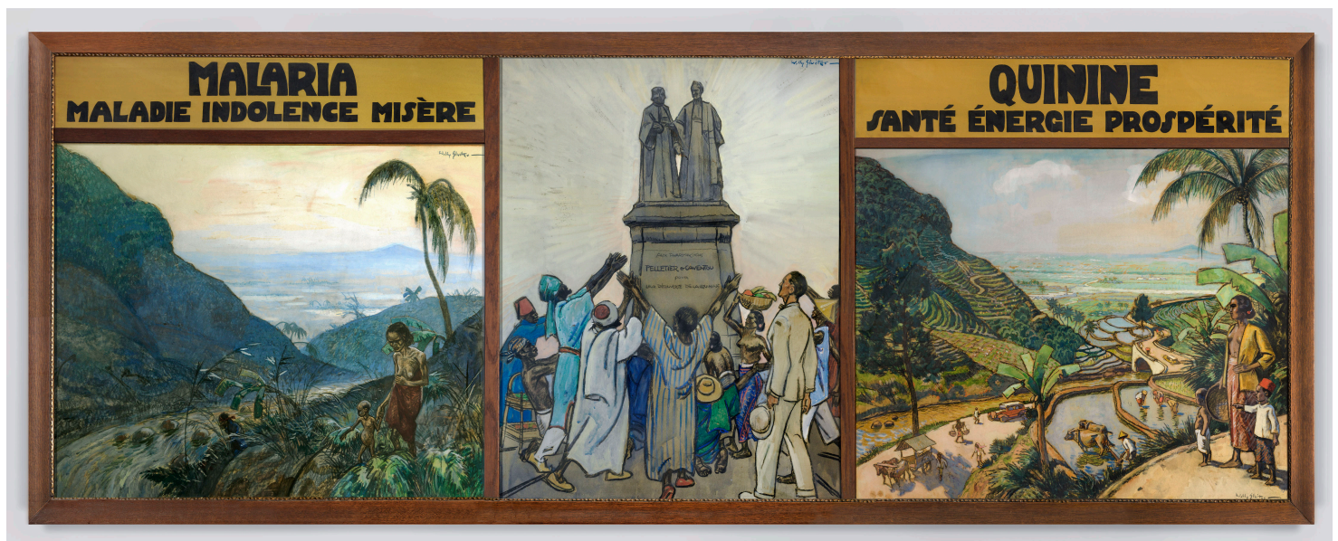
Lof op de kinine, krijttekening 1931, door Willy Sluiter (1873-1949). Collectie Allard Pierson.

Halverwege de negentiende eeuw verplaatsten Nederlanders en Britten de kweek van kinabomen vanuit Latijns-Amerika naar hun eigen koloniën. Kinine kon vervolgens doeltreffend worden ingezet voor de