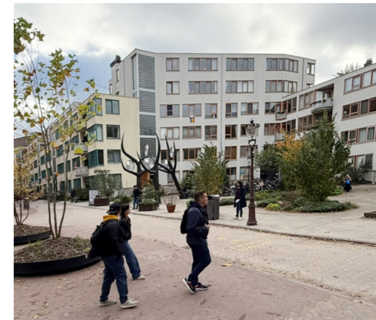
In 1986 kwam er voor er eerst woningbouw in het kerngebied (dia 10).

Met twintig jaar vertraging is het gewijzigde plan nu gerealiseerd. Met een fraai resultaat. Dankzij de vertraging is het programma van eisen geheel up-to-date, passend