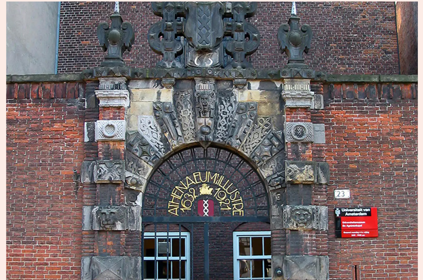
Ingang van het Athenaeum Illustre.

Het Athenaeum Illustre, de Doorluchtige School, was in 1632 de eerste instelling voor hoger onderwijs in Amsterdam, de voorloper van de Universiteit van Amsterdam