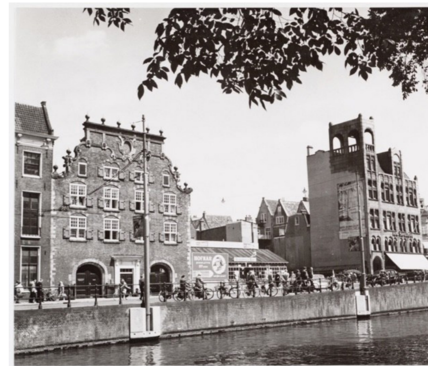
Foto UB-locatie tussen 1959 en 1961.