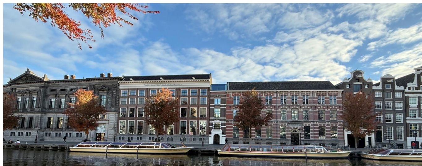
Gebouwen overleven soms gedeeltelijk: de gevel van het Bernardusgesticht bleef staan, erachter werden bibliotheek Bijzondere Collecties gehuisvest (dia 12).

bij gedrag en wensen van de gebruikers van vandaag. Kilometers minder boekenplanken. Alles op en top digitaal. Een luxe fietsenkelder om de straat schoon te houden. En niet onbelangrijk: de strijdbijlen zijn begraven. Omwonenden tevreden, actievoerders gerust. Tegelijk is er ook hier geen voordeel zonder nadeel. De bouwkosten zijn ruim meer dan het dubbele. En het bruikbare vloeroppervlak is bijna de helft minder. In de negentiende eeuw was vooruitgang in de gezondheidszorg een kwestie van hygiëne en sanitair, lucht en licht. Dat vergde beddenhuizen met hoge plafonds, veel hoger dan nodig voor een bibliotheek of studiezaal.