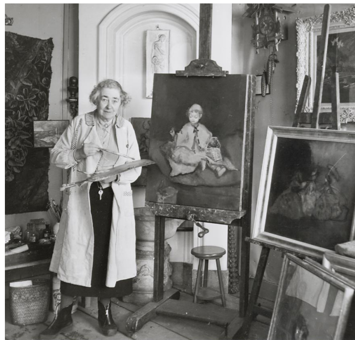
Lizzy Ansingh, geportretteerd naar aanleiding van haar 80ste verjaardag in haar atelier, Prinsengracht 1091, 3 maart 1955.