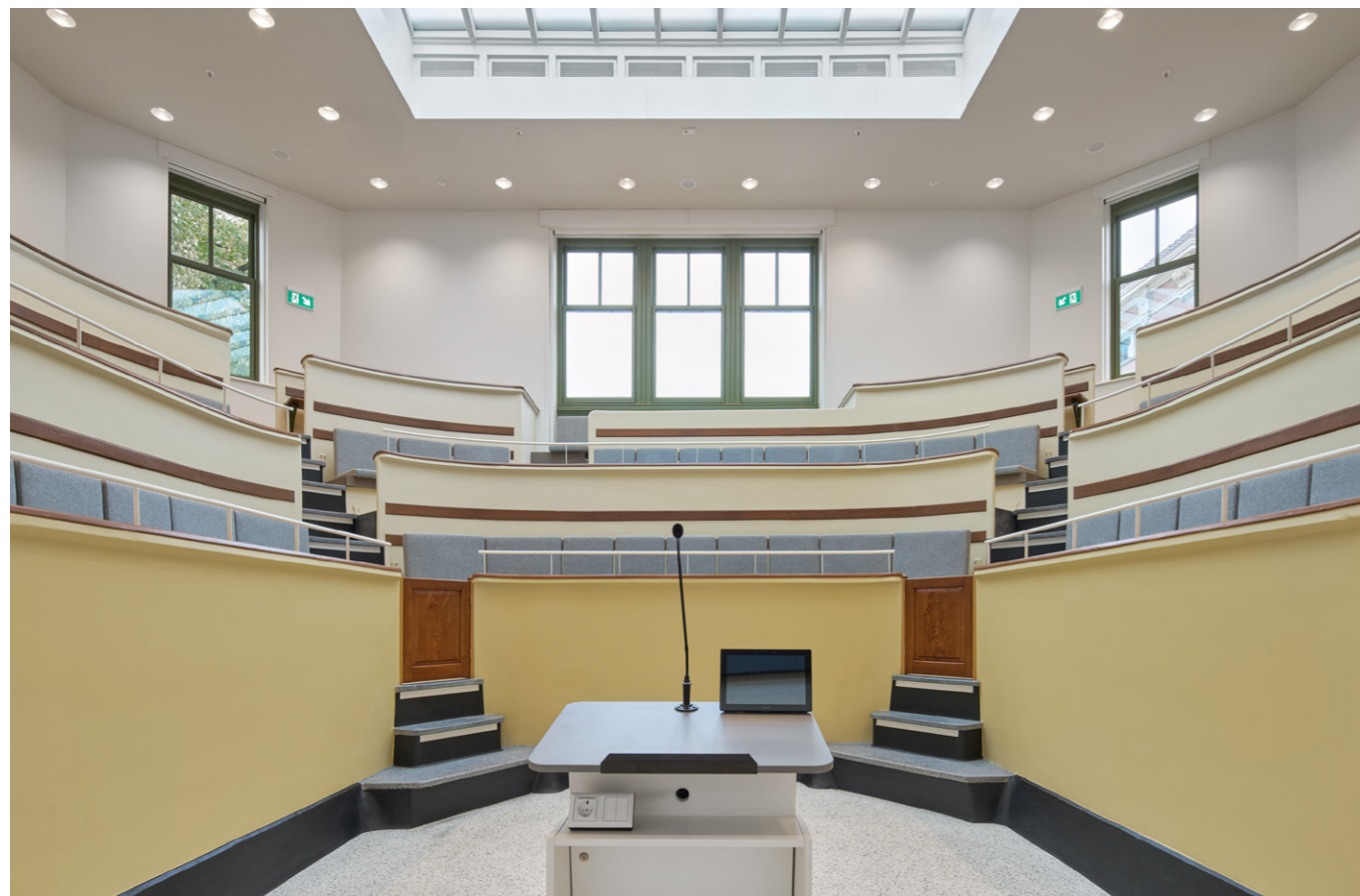
Chirurgisch Theater na de renovatie.

toen in gebouw 3, en weer terug naar gebouw 5; afdelingen van Rechten; filosofen in het Zusterhuis; CREA1 met het legendarische CREA-café in BG2; CREA2 met de studentenorganisaties aan de Vendelstraat. En dan vragen de UvA-senioren – als voormalige vaste bezoekers – natuurlijk ook naar het gebouwtje van de Academische Club. Van Gulik vertelde over het gebouw met de markante klok dat het voor iedereen duidelijk was wat er bedoeld werd als men over iemand zei dat diegene ‘onder de klok liep’: het was de polikliniek dermatologie en venerische ziekten. Voor Van Gulik en voor de geneeskunde is het natuurlijk nog de moeite waard om stil te staan bij de grafresten uit 1615 die gevonden zijn bij het uitgraven van de fietsenkelder onder de nieuwe Universiteitsbibliotheek. Er wordt samen met archeologen van de Gemeente Amsterdam en van de UvA onderzoek gedaan naar de doodsoorzaken. ◀