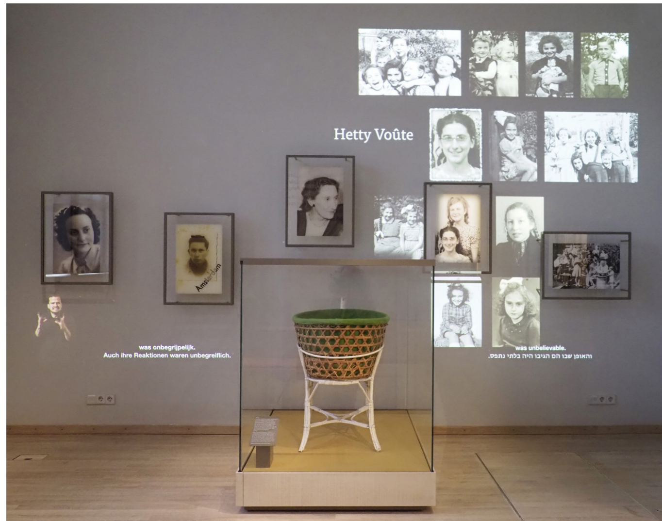
Klaslokaal door Johan van Hulst, directeur van de Kweekschool, bestemd voor de jongste kinderen uit de crèche om rustig te kunnen slapen en wellicht overgebracht te worden naar veilige onderduikadressen; nu ingericht als museumzaal.

familiegeschiedenissen van levende personen zijn verbonden, zoals de schrijftafel van de voorzitter van de Joodse Raad David Cohen, die daaraan voorlas aan zijn kleinzoon Rob Oudkerk.