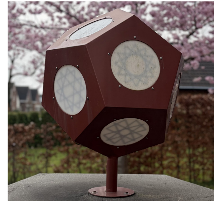
De dodecaëder op de brievenbus.