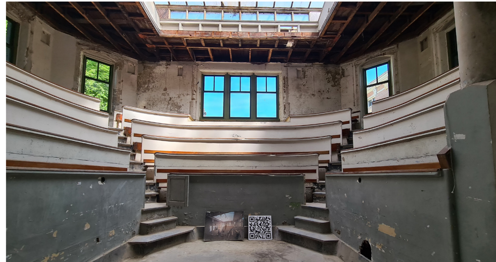
Chirurgisch Theater tijdens de renovatie.

Door het bestuur werd zo een professorale ruzie bezworen