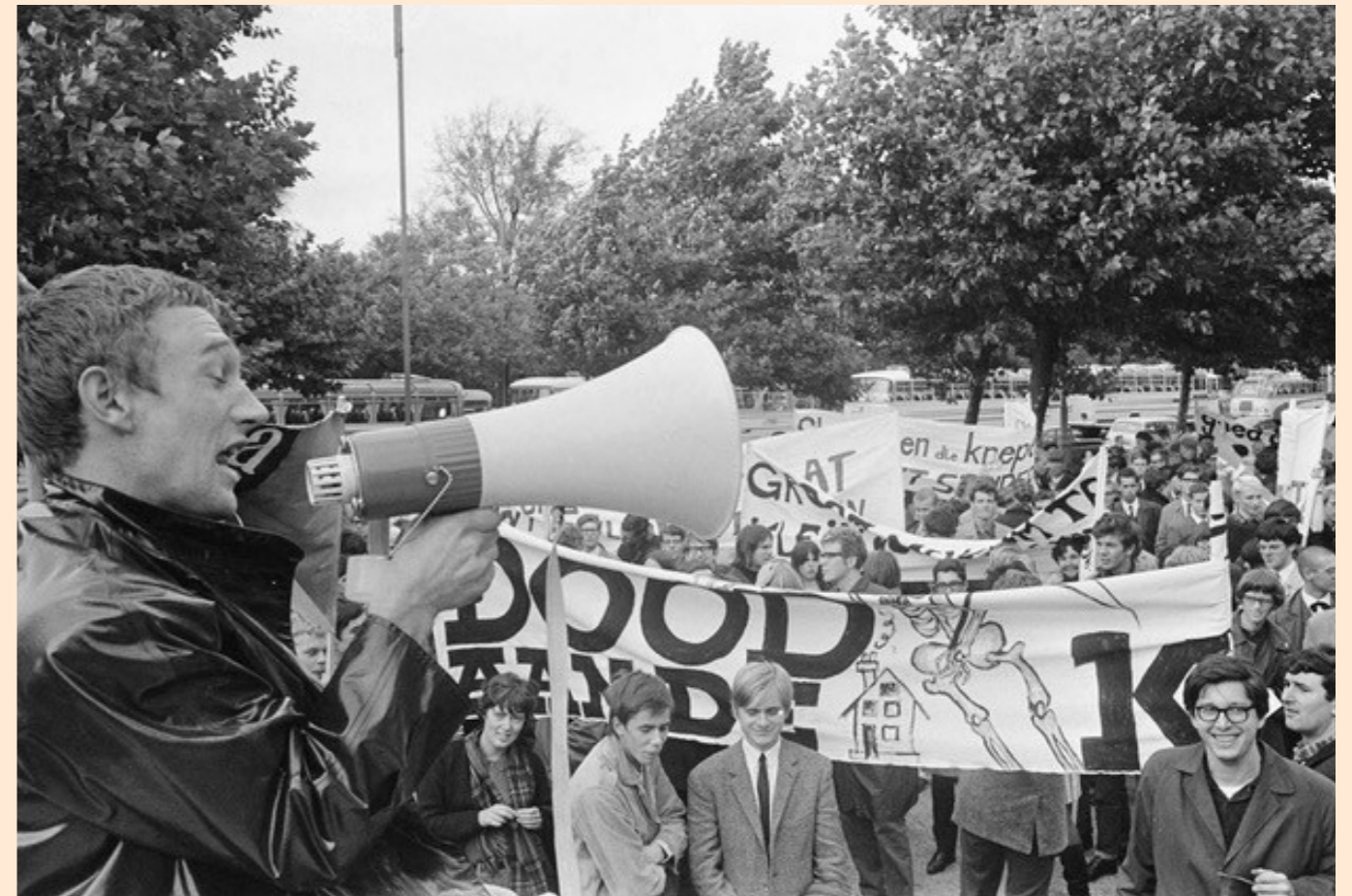
Demonstratie op het Museumplein.

Om weerstand te bieden aan de vijandigheid jegens de wetenschap moet volgens Dijkgraaf de wetenschap de samenleving uitleggen hoe ze werkt en wat ze doet. Als minister kreeg hij een budget van tien miljard euro voor wetenschappelijk onderzoek, maar toen hij voorstelde tien miljoen daarvan te reserveren voor een centrum dat de wetenschap in de samenleving zou ‘doen landen’ trok juist dat veel publiciteit. Toch bieden dergelijke initiatieven een uitweg uit de huidige malaise, aldus de universiteitshoogleraar Wetenschap en maatschappij. ◀