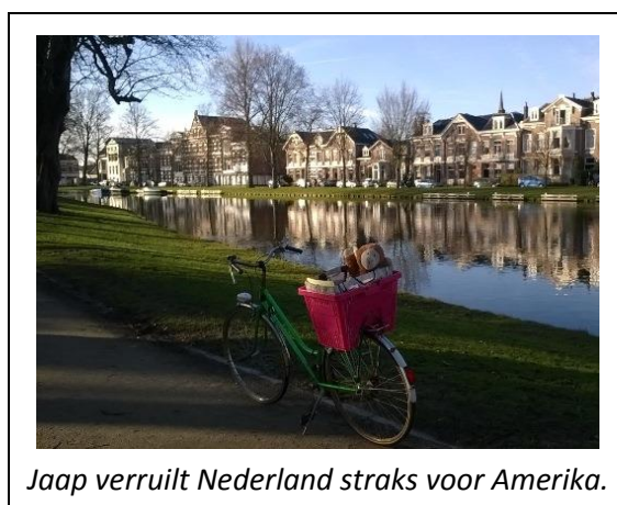
Jaap verruilt Nederland straks voor Amerika.

Een ander aspect dat we graag willen uitzoeken is in hoeverre deze ontwikkeling in het Nederlands nu verschilt van die in andere talen. In 2016 gaat Jaap de Aap daarom écht op reis: we gaan aan kinderen in de Verenigde Staten vragen of ze Jaap willen helpen. Waarom daar? Uit eerder onderzoek bleek al hoe en wanneer Amerikaanse kinderen hoofdtelwoorden leren, maar ons onderzoek roept vragen op over hoe het met hun rangtelwoordkennis zit. Het zou kunnen dat Amerikaanse kinderen meer moeite hebben met rangtelwoorden, omdat lage rangtelwoorden in het Engels allemaal onregelmatig zijn, en dat helpt niet als het leren van een regel bij dit proces belangrijk is. Het rijtje begint niet oneth , twoth , threeth , fourth , fiveth maar first , second , third , fourth , fifth . De regel (hoofdtelwoord plus -th in dit geval) komt pas daarna. Wat betekent dit voor hun ontwikkelingspatroon? Hebben Amerikaanse kinderen dan ook meer tijd nodig om die vormen (en de regel) te leren?