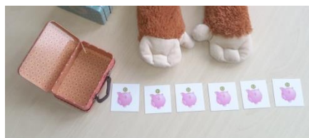
De derde spaarpot mag mee!

Jaap de Aap is een hele lieve aap. Binnenkort gaat hij op vakantie. Waar hij heen gaat, is nog even een verrassing, maar hij heeft vast al zijn spulletjes verteld van zijn grote reis. Dat vinden zij zo leuk dat ze allemaal mee willen. Ze staan zelfs in de rij om in de koffer te springen! Maar o jee, ze passen er niet allemaal in! Wie helpt hem de juiste spullen uit de rij te vinden en in te pakken?